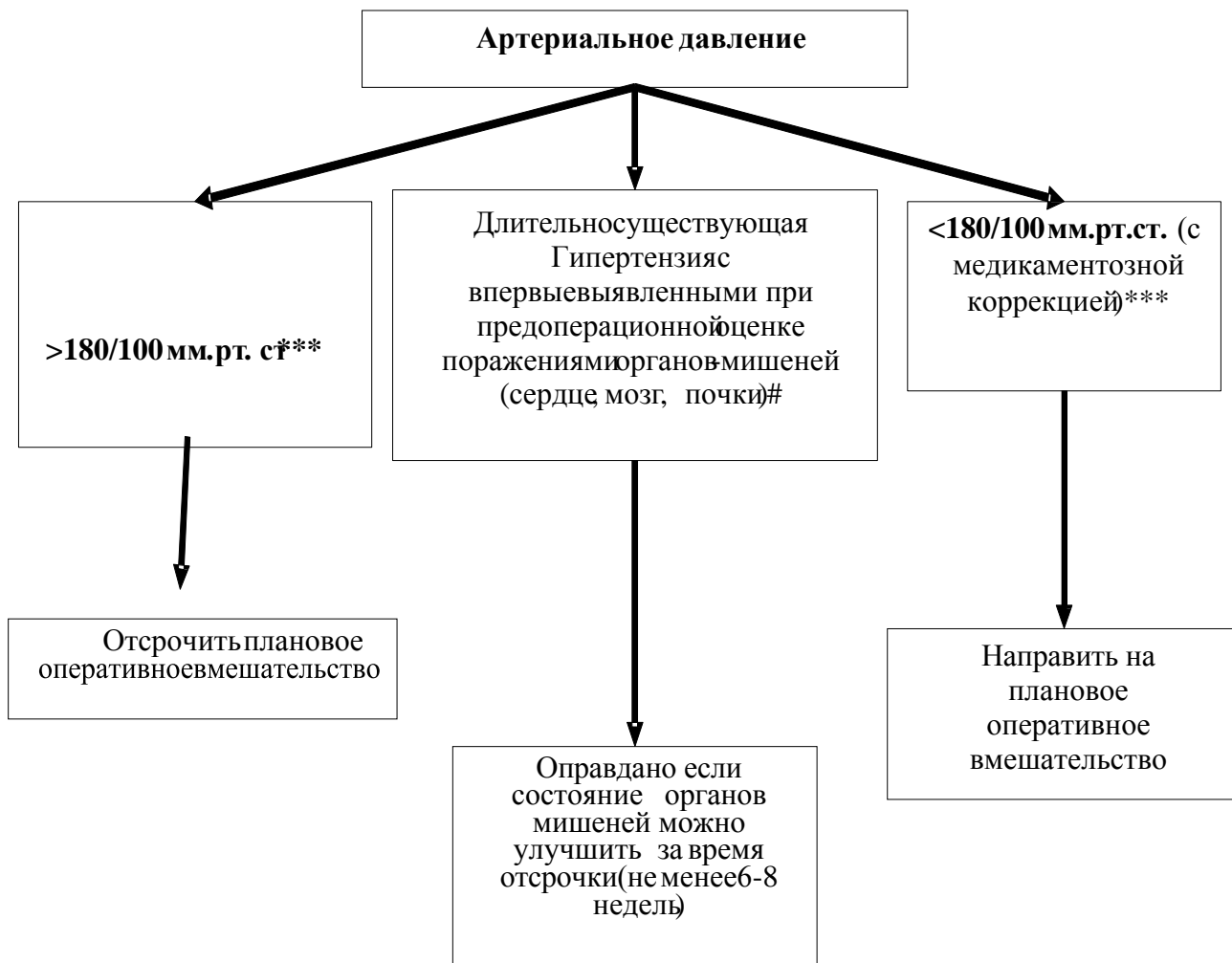
Рисунок 2. Алгоритм принятия решения о переносе операции и/или предоперационной подготовки пациентов с гипертензией [3].