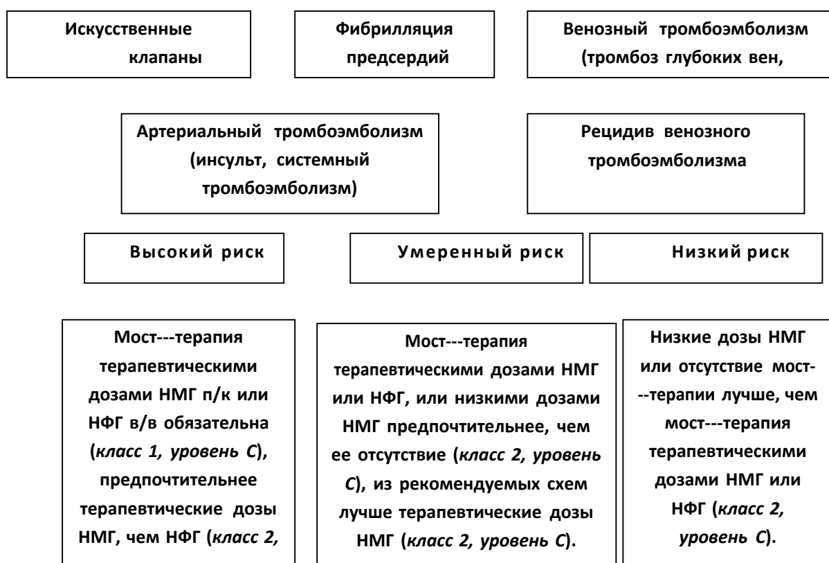
Рис. 1. Доказательные подходы к мост-терапии в связи с прерыванием приема варфарина

кровотечения, то назначение антикоагулянтов противопоказано. Возобновление введения НМГ у пациентов с высоким риском кровотечения необходимо отсрочить после операции на 24-48 часов ( класс 1, уровень С ). В определенных ситуациях (например, нейрохирургические и некоторые ортопедические вмешательства), при которых послеоперационное кровотечение, связанное с антикоагуляцией может привести к тяжелым последствиям, возобновление введения терапевтических доз НМГ может быть отсрочено после операции на 48-72 часа даже при наличии у пациента адекватного послеоперационного гемостаза. При очень высоком риске послеоперационного кровотечения возобновление введения НМГ может быть начато не в терапевтических, а в профилактических дозировках. Для снижения риска кровотечения необходимо учитывать функцию почек при назначении и выборе дозы антикоагулянтов, которые выводятся почками, в частности, у пациентов пожилого возраста (старше 75 лет), при наличии ХПН, сахарного диабета. При назначении антикоагулянтов необходимо определить уровень креатинина в крови и рассчитать его клиренс с помощью формулы Кокрофта – Голта (см. Приложение 1).